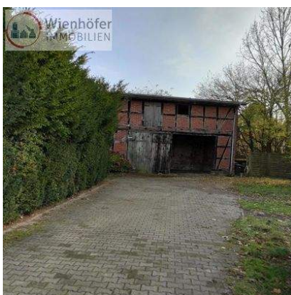
Hofeinfahrt mit Carport